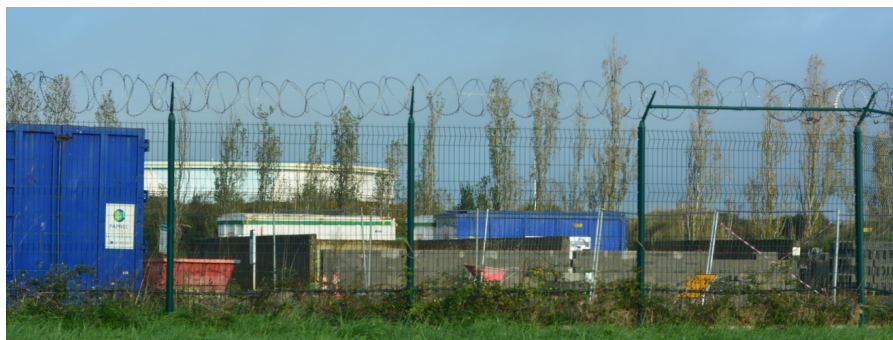
3 source du problème